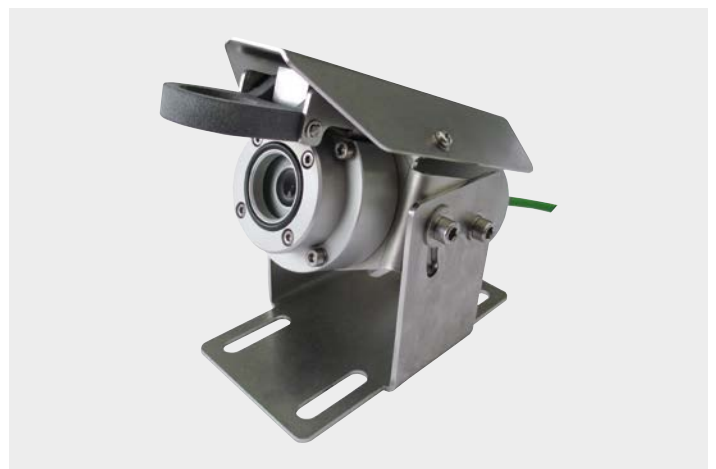
BARTEC Kamera Ex