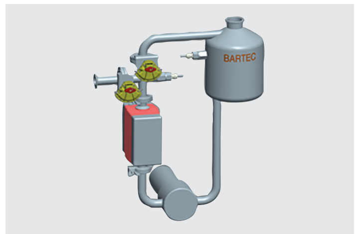
Messsystem für Harnstoff und Diesel