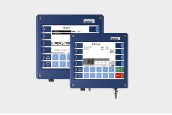
PETRO 3003 Safe/Spds

Entegre veri iletişimli modüler sistem çözümü